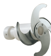
Shaft with knives for pesto sauce