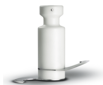
Shaft with knives to mix dough