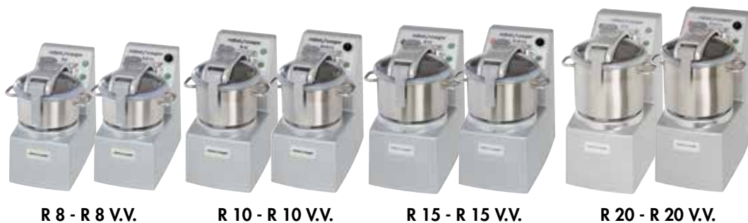
R 8 - R 8 V.V.