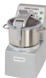
R 15 - R 15 V.V.