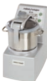
R 10 - R 10 V.V.