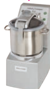
R 20 - R 20 V.V.