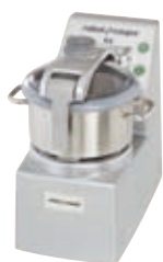
R 8 - R 8 V.V.