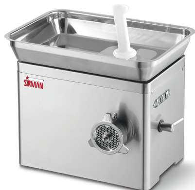
Sirman Мясорубки , model TC 22 Nevada :

Sirman Spa Viale dell'Industria 9/11 35010 PIEVE DI CURTAROLO (PD), Italy Tel./Fax. +39 049 9698666 / +39 049 9698688 email: info@sirman.com