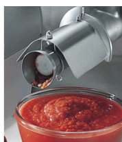
Optional tomate sauce making