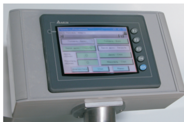
Сенсорная панель управления «Прима-300»